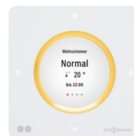
Votrol 300-E komfortowa bezprzewodowa jednostka zdalnej obsługi jako osprzęt dodatkowy