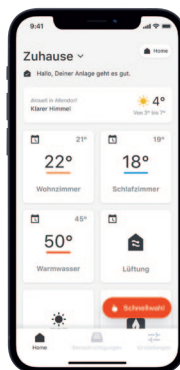
Aplikacja mobilna ViCare do obsługi kompletnego systemu energetycznego

Zawarte w usuwanym powietrzu cząsteczki pary wodnej dyfundują przez membranę i są pochłaniane przez doprowadzane powietrze świeże. Dzięki temu można wyeliminować zarówno zbyt suchą, jak i nadmierną wilgotność powietrza w pomieszczeniu. Ponieważ równocześnie membrana polimerowa uniemożliwia przenikanie wirusów, bakterii i zarodników pleśni, Vitoair FS jest również rozwiązaniem doskonałym higienicznie.