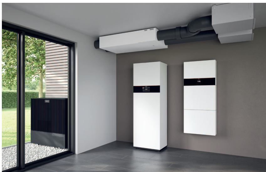
System wentylacji mieszkań Vitoair FS z pompą ciepła powietrze/woda Vitocal 252-A i systemem magazynu prądu Vitocharge VX3

Centralny system wentylacji mieszkań Vitoair FS zapewnia zdrowy klimat pomieszczeń i przyjemne temperatury w całym domu.