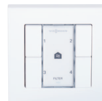
Przycisk czterostopniowy z sygnalizacją potrzeby wymiany filtra